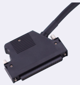
※图片为FCN40芯连接器产品