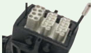
①モジュールユニットを外す