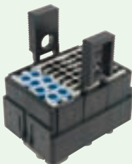
②取外し工具を差し込んで、モジュールを外す。 ※中心が一番外し易い