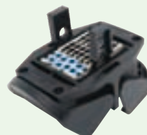
①取外し工具を差し込んで、モジュールを外す。 ※中心が一番外し易い