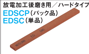
■スティック砥石自体の硬度目安